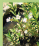
Gratiola officinale