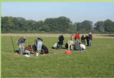
La récolte et le comptage des vers de terre