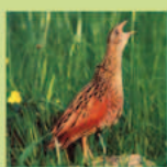
Nain des gentils