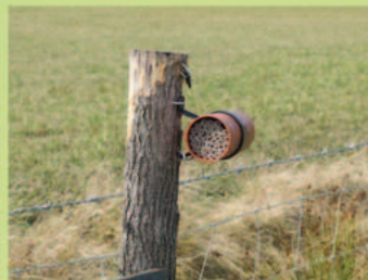
Le nichoir à pollinisateurs