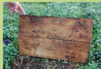
La récolte et le comptage des invertébrés