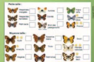
Le comptage et l'identification des papillons sans capture