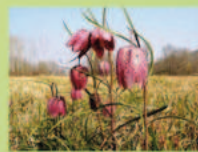
Fritillaire pontica